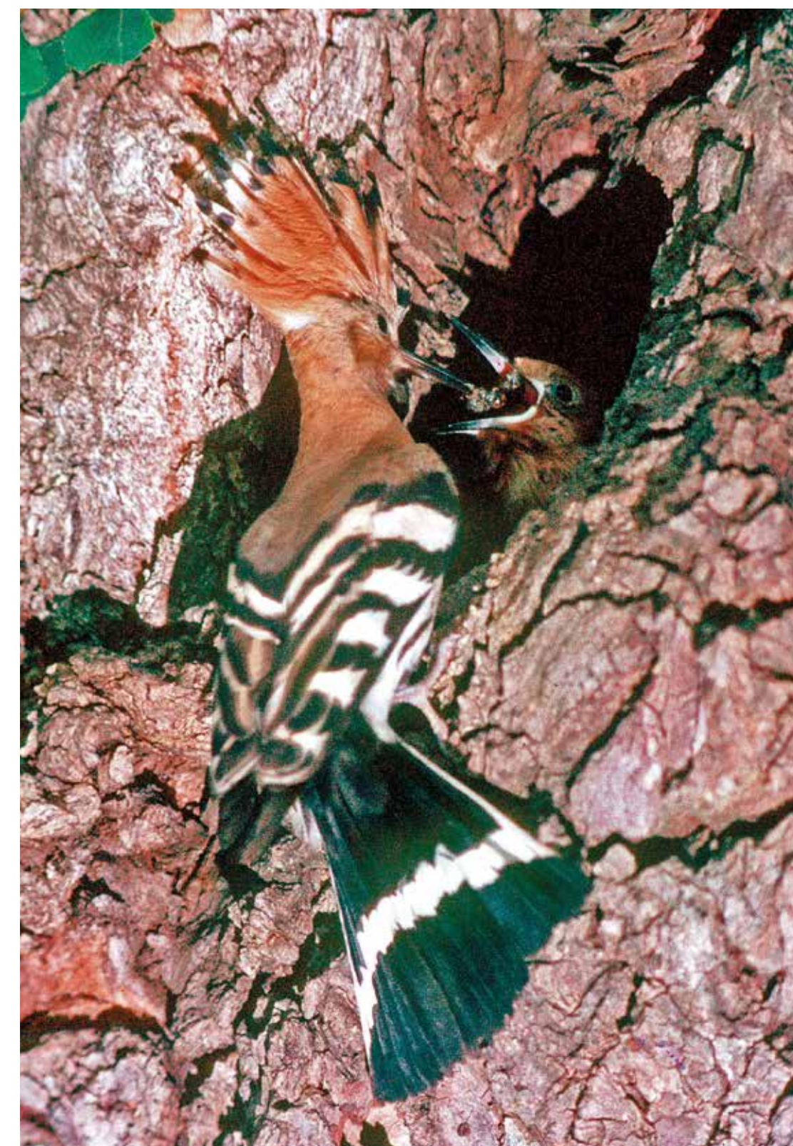
Wiedehopf ( Upupa epops ) und Schachbrettfalter ( Melanargia galathea ) zwei der besonders schönen Arten, die auf den Schutzflächen von Rechnitz eine Heimat gefunden haben.

Grünräume in den Gemeinden sorgen für mehr Lebensqualität – bei uns Menschen, aber auch bei Fauna & Flora, die auf diesen Flächen Lebensraum finden. Durch die Einrichtung von kleinräumigen Schutzgebieten im lokalen Verwaltungsbereich von Gemeinden entstehen „Ökozellen“, die als Rückzugsgebiet zur Erhaltung bedrohter Tier- und Pflanzenarten betragen. Nicht nur hier in Ollersdorf, sondern in vielen Gemeinden des Landes, sodass ein Netz an Schutzflächen geschaffen werden kann. Interessierte Naturliebhaber und Erholungssuchende sind eingeladen diese Flächen zu besuchen und auf Entdeckungsreise zu gehen! Ermöglicht wird dieses Projekt durch eine LEADER Förderung der EU.