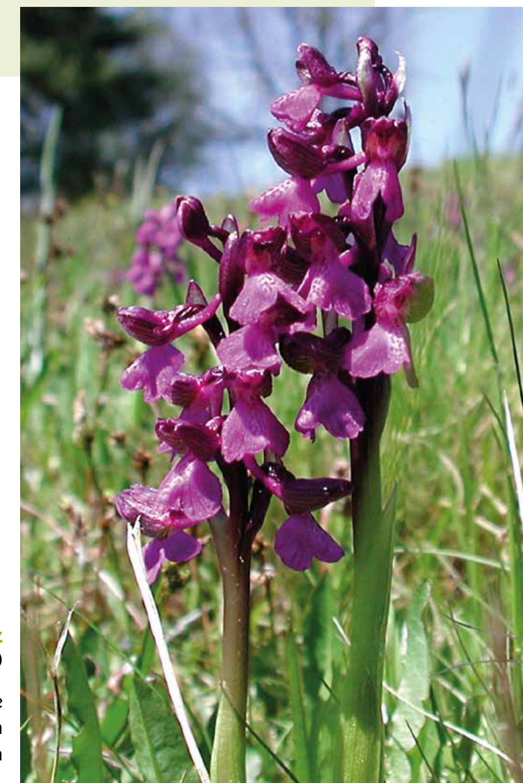
Hundswurz ( Anacamptis morio )

Orchideen wie diese gehören zu den Raritäten auf den Rechnitzer Wiesen.